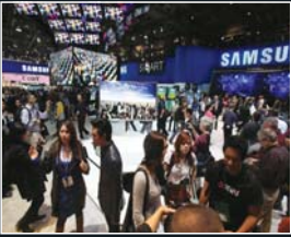
T. 10 CES 2011: Samsung giới thiệu "Một cuộc sống thông minh hơn"