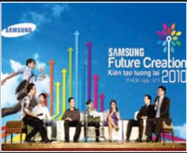
T.14 Những sự kiện SAVINA nổi bật năm 2010