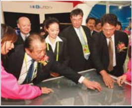
T.4 Trung tâm triển lãm Samsung tại Á Vận hội Quảng Châu 2010