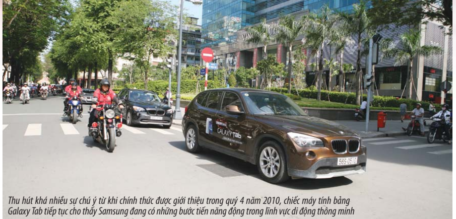
Thu hút khá nhiều sự chú ý từ khi chính thức được giới thiệu trong quý 4 năm 2010, chiếc máy tính bảng Galaxy Tab tiếp tục cho thấy Samsung đang có những bước tiến năng động trong lĩnh vực di động thông minh

“ Năm 2010, Samsung Electronics (Samsung) đã đầu tư khoản kinh phí lớn nhất từ trước đến nay - gần 18 tỷ USD - cho các hoạt động nghiên cứu phát triển công nghệ và mở rộng sản xuất. Đây là một quyết định quan trọng giúp Samsung khẳng định vị thế tiên phong về công nghệ trong một số lĩnh vực then chốt. Đặc biệt trong năm qua, “xanh” và “thông minh” là hai từ được nhắc đến khá nhiều trong xu hướng sản xuất và trong các sản phẩm của Samsung. ”