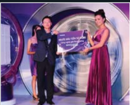
T.19 Samsung vén bức màn bí mật của người phụ nữ thành công