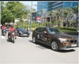
T.18 Samsung với xu hướng sản xuất xanh & sản phẩm thông minh