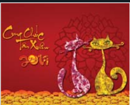
T.23 Xem tử vi của người tuổi Mão